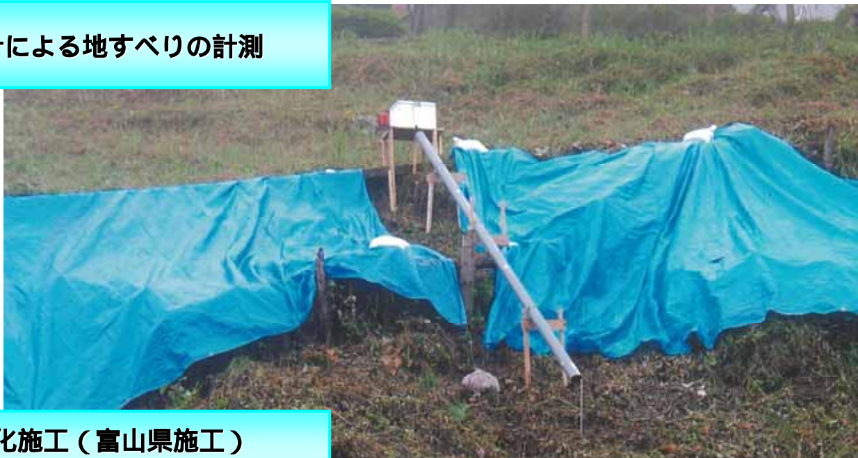
無人化施工（富山県施工） ～富山県南砺市国道156号地すべり～ とやまけん なんとし