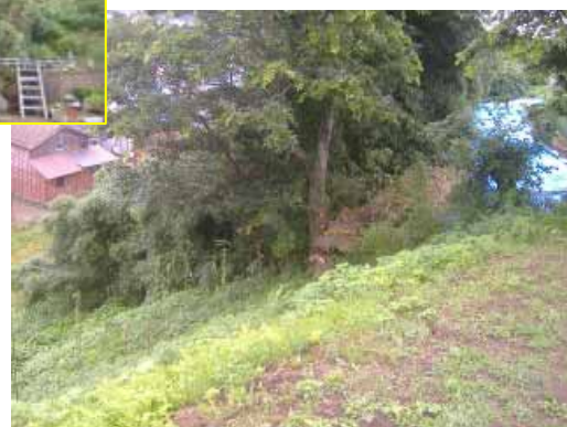
かしわざきし くじらなみ 新潟県 柏崎市 鯨波3丁目