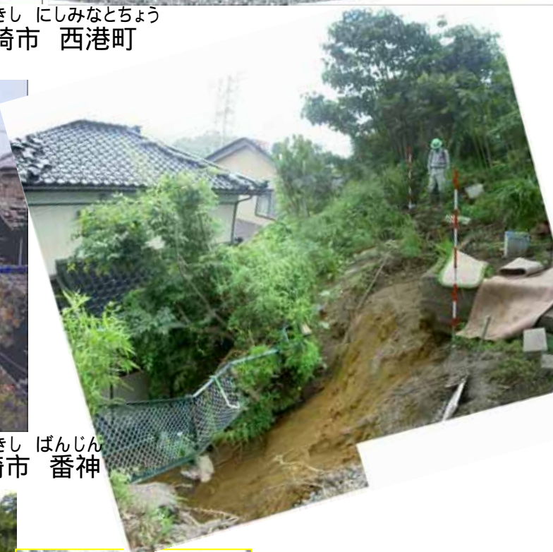
かしわざきし ばんじん 新潟県 柏崎市 番神