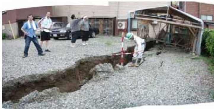
かしわざきし にしみなとちょう 新潟県 柏崎市 西港町