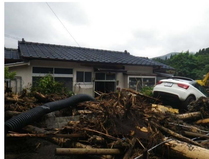
② 被害状況 (人家半壊1戸)