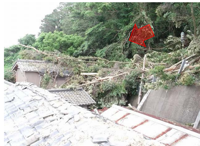
② 被害状況 (人家一部損壊1戸)