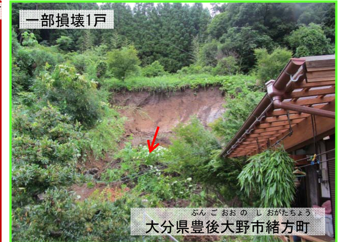
大分県豊後大野市緒方町