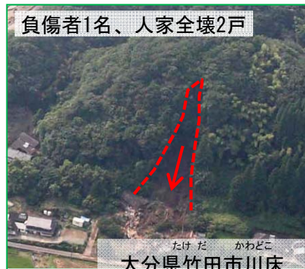
大分県竹田市川床