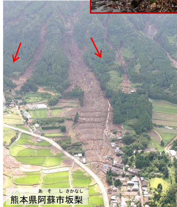
熊本県阿蘇市坂梨