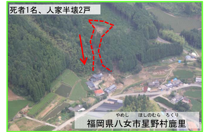
福岡県八女市星野村鹿里