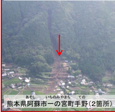
熊本県阿蘇市一の宮町手野(2箇所)