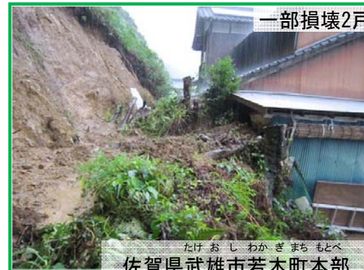
佐賀県武雄市若木町本部