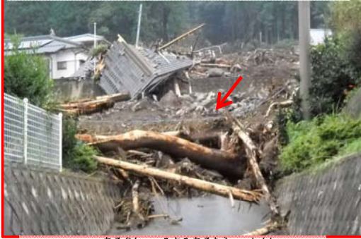
熊本県阿蘇郡南阿蘇村新所