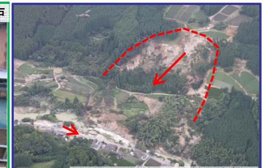
福岡県八女市星野村柳原