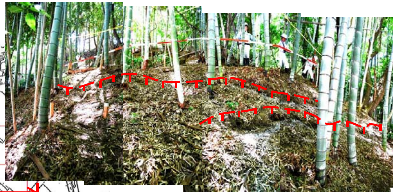
③竹林の中に新たにできた複数の亀裂