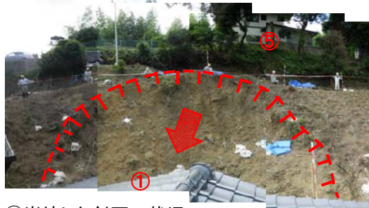
①崩壊した斜面の状況