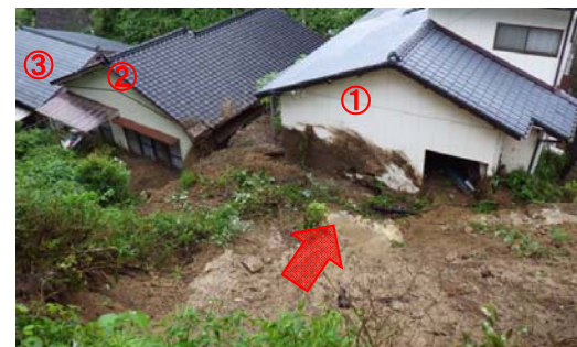
②がけ崩れにより被災した人家