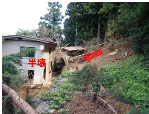
④がけ崩れにより被災した人家