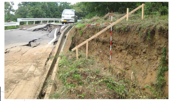
地すべりブロック頭部滑落崖

【八本松地区】 みましあなぶきまち 美馬市穴吹町 発生日時 : 平成26年8月9日 保全対象 : 市道 崩壊の規模 : 幅95m 長さ100m 主な対策工 : アンカー工 N=96本