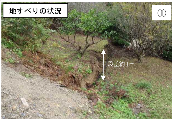
頭部の滑落崖の状況