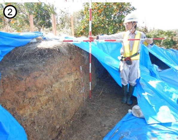
地すべりブロック頭部の亀裂 (段差 約1.2m)