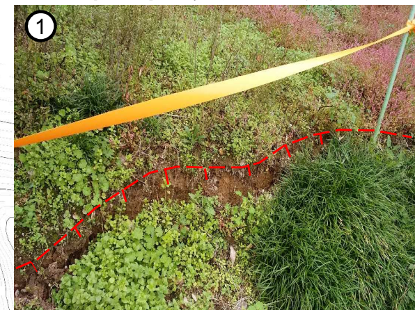
地すべりブロック頭部の亀裂 (段差0.1~0.2m)