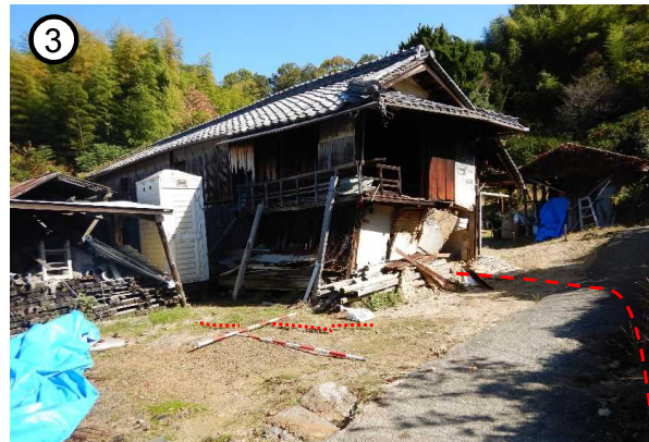
半壊した空き家の状況

【国分町地区】 大阪府和泉市国分町 発生日時 : 平成29年10月23日 保全対象 : 人家10戸 崩壊の規模 : (北側) 幅30m 長さ35m (南側) 幅45m 長さ65m 主な対策工 : 横ボーリング工、鋼管杭工 等