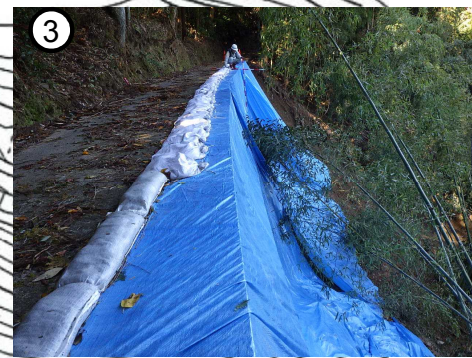
地すべりブロック頭部の状況