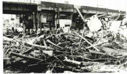
（中央区）J R高架北側の堆積土砂（S42災害）