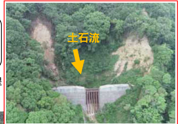
三の谷1号砂防堰堤（神戸市須磨区）（H23.6年完成）