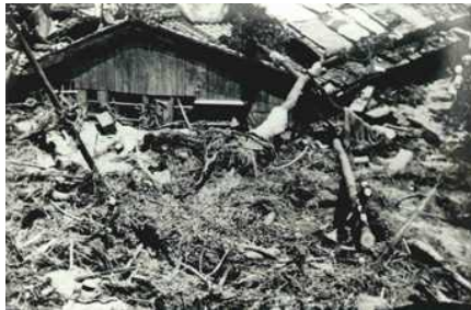
荒田町（兵庫区）の土砂で埋没した家屋（S13災）