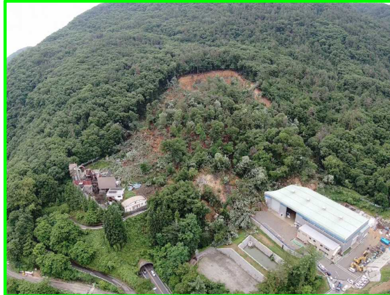
7/3 あたみ いずさん 静岡県熱海市伊豆山