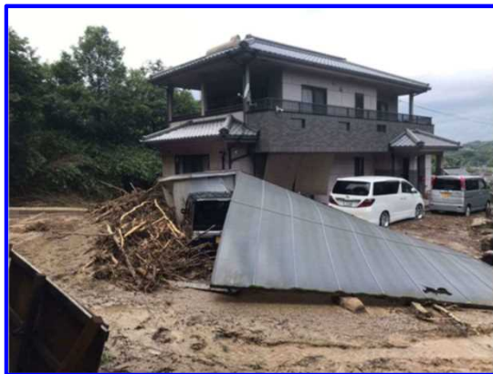
7/8 土石流等 みはら こいずみ 広島県三原市小泉町