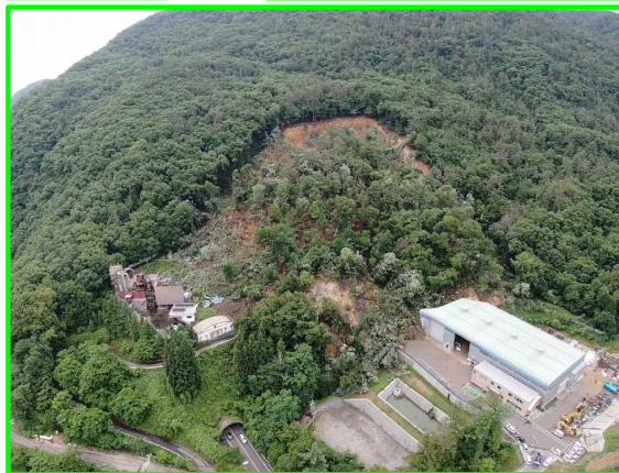
7/6 ながの しののい 長野県長野市篠ノ井 地すべり