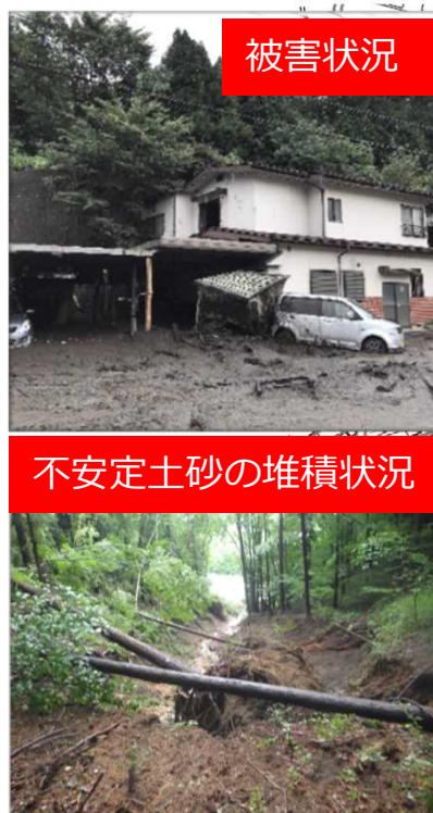
不安定土砂の堆積状況