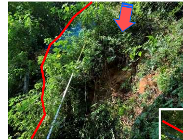
がけ崩れ状況 (がけ上側)