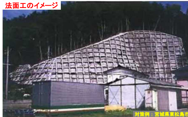
法面工のイメージ

【千代町地区】 ふくおかけん たがわし ちよまち ちない 福岡県田川市千代町地内 ・発生日時 : 令和3年8月14日 ・保全対象 : 人家4戸 ・崩壊の規模 : 幅38.0m 高さ10.0m ・主な対策工 : 法面工