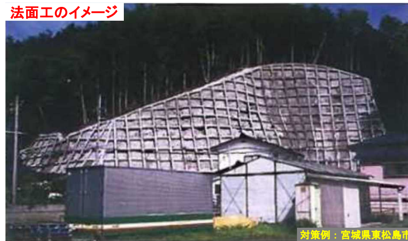
法面工のイメージ