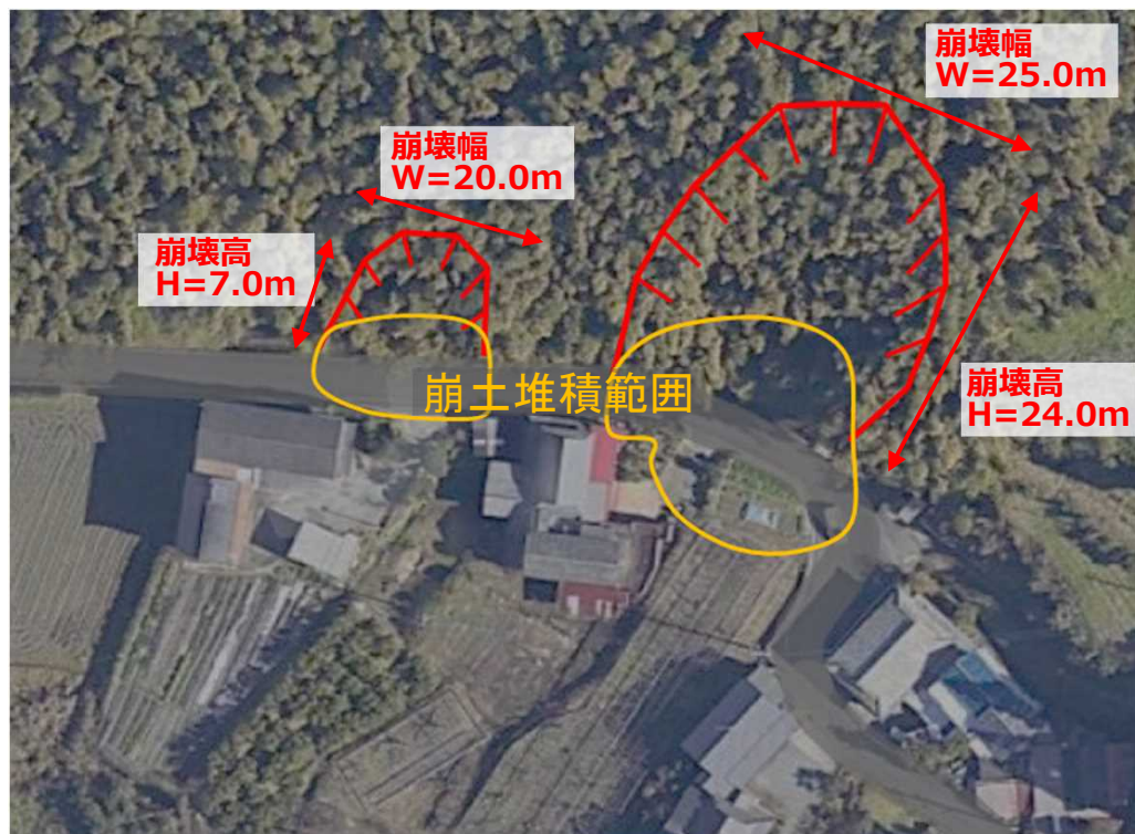
がけ崩れ状況 (がけ上側)