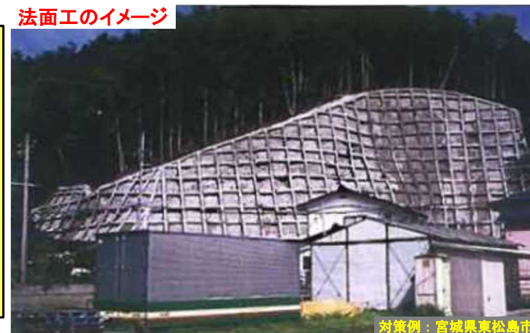
法面工のイメージ