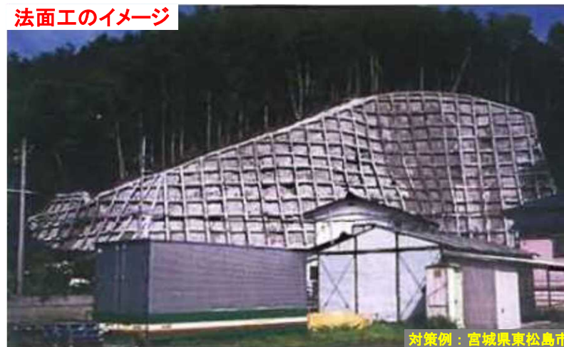
法面工のイメージ