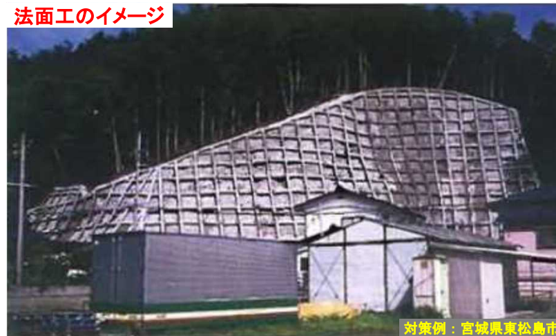
法面工のイメージ