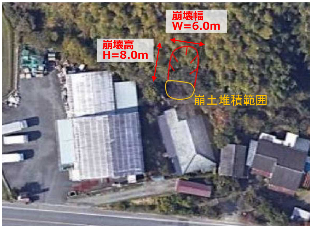
がけ崩れ状況 (がけ上側)