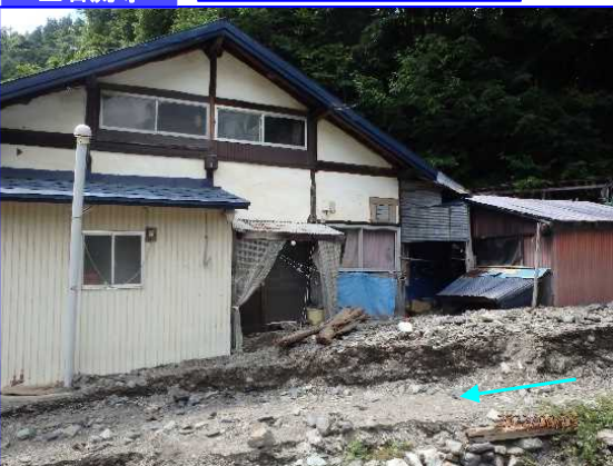
8/3 くずまきまちたれやなぎ 岩手県葛巻町垂柳