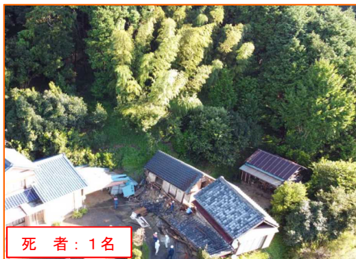
9/24 かけがわしゆけ 静岡県掛川市遊家