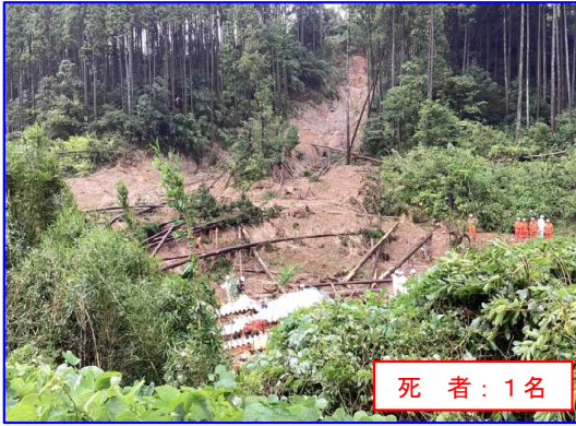
9/19 みまたちょうながた 宮崎県三股町長田