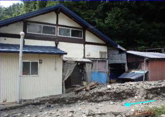
8/3 くずまきまち たれやなぎ 岩手県葛巻町垂柳