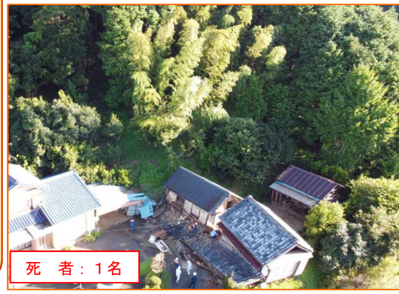
9/24 かけがわしゆけ 静岡県掛川市遊家

人的被害：死者 4名※ 負傷者 8名 家屋被害：全壊 33戸 半壊 39戸 一部損壊 212戸 ※災害関連死は除く