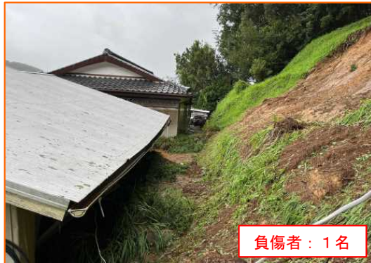
9/19 ひのかげちょうななおれ 宮崎県日之影町七折