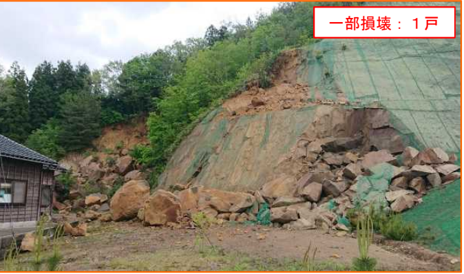
5/5 がけ崩れ すずし しょういんまちおかた 石川県珠洲市正院町岡田