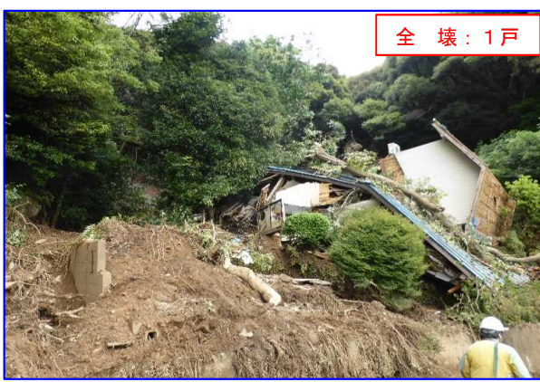
6/2 土石流 とよかわしみとちようひろいしみとやま 愛知県豊川市御津町広石御津山