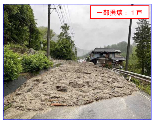
6/2 土石流 いいだし みなみしなの みなみわだ 長野県飯田市南信濃南和田