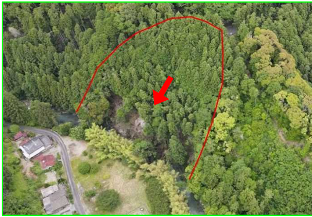
6/2 地すべり はままつてんりゆうくながさわ 静岡県浜松市天竜区長沢