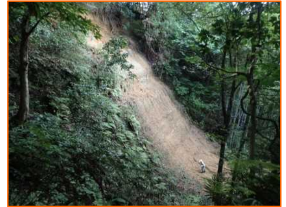
6/2 がけ崩れ はままつし きたくほそえちようきが 静岡県浜松市北区細江町気賀