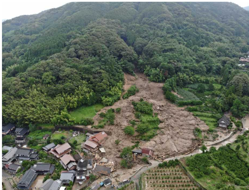
溪流土砂堆積状況