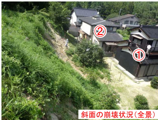
斜面の崩壊状況(全景)