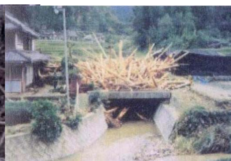
＜写真2：平成5年台風 橋を閉塞させた流木＞ (大分県中津市)