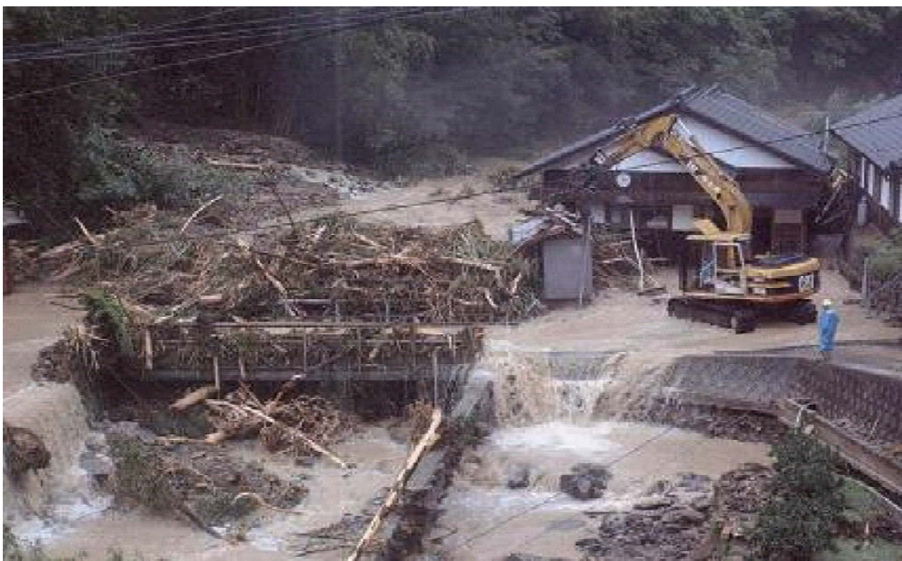
＜写真3：平成16年8月台風15号における土砂災害＞

落合川、落合上川の土石流により、二級河川前田川との合流下部の橋梁が閉塞し、自主避難していた4名の内2名が濁流に流されて死亡。(香川県観音寺市)