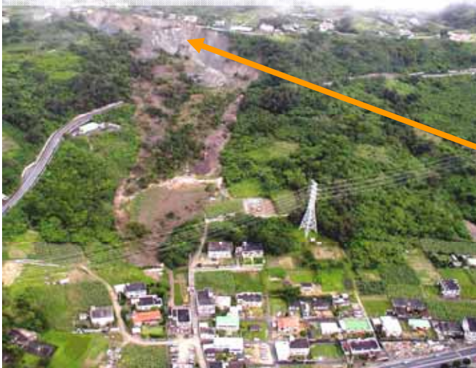
沖縄県中頭郡中城村 (地すべり)