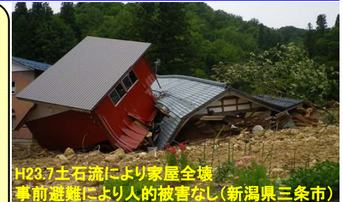
死者・行方不明者における高齢者の割合 (H17~H22)