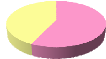
土砂災害による犠牲者の約6割が高齢者