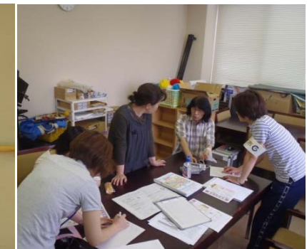
手作りハザードマップの作成 (石川県七尾市)