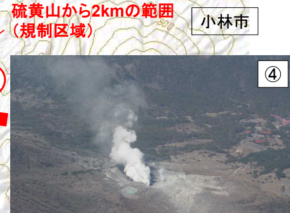
火口周辺では明瞭な火山灰の堆積なし