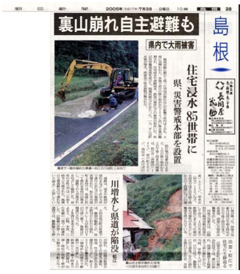
朝日新聞(島根) 7月3日 夕刊