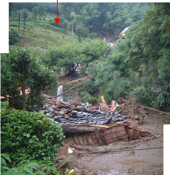
愛媛県伊予市中山町においてがけ崩れが発生 人家一戸が全壊(避難していたための被害無し)