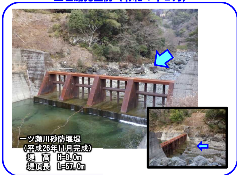
土石流発生前（令和4年2月）