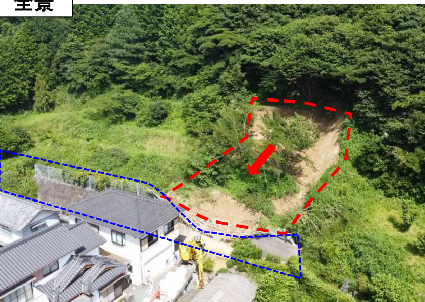
急傾斜地崩壊防止施設 (落石防護柵及び擁壁)