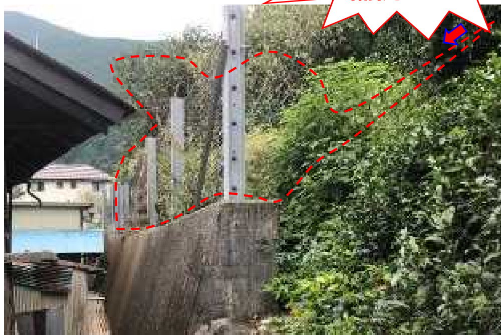
※周辺人家 (写真左側) に被害無し