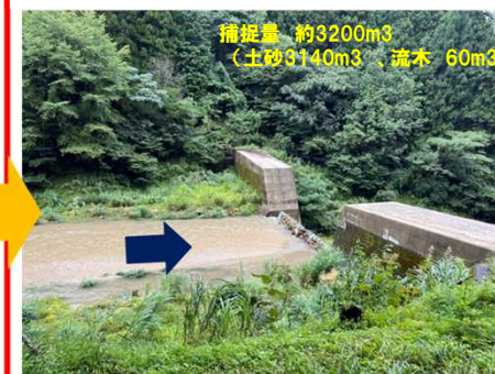
出水後: 令和5年8月16日撮影