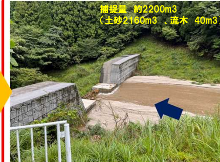
出水後: 令和5年8月16日撮影