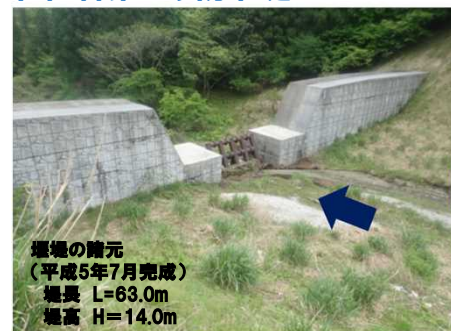
出水前: 令和3年5月13日撮影