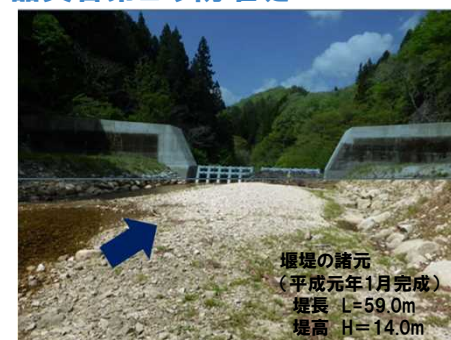
出水前: 令和3年6月11日撮影