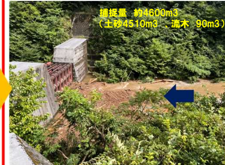
出水後: 令和5年8月16日撮影