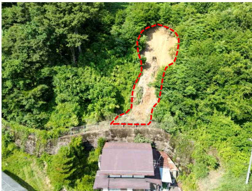
がけ崩れ発生状況