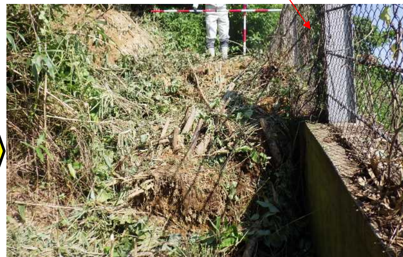
急傾斜地崩壊防止施設