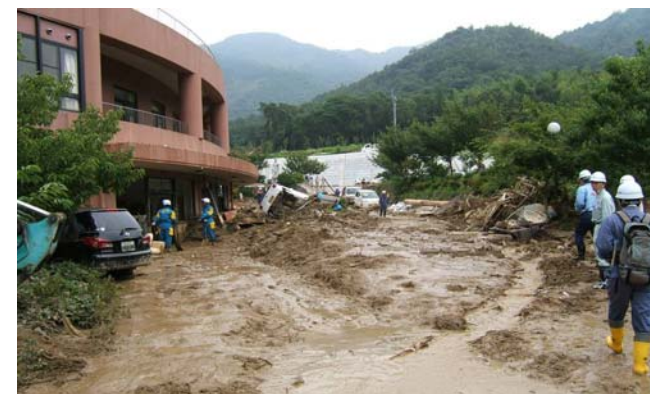
ほうふ 山口県防府市 平成21年7月発生 死者7名(災害時要援護者)