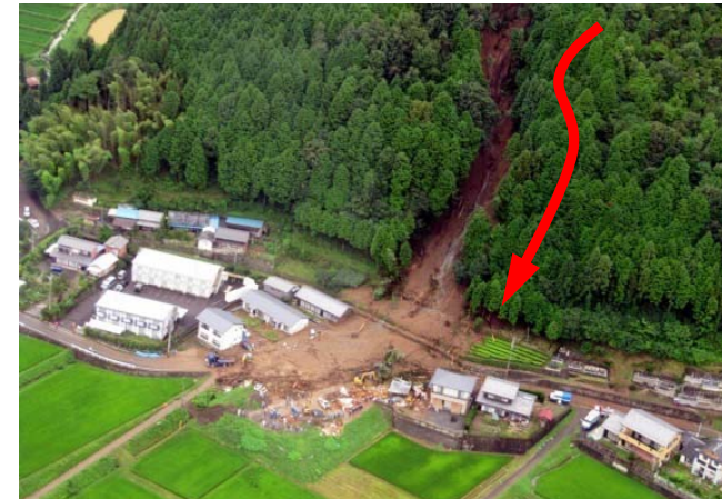
やおつ 岐阜県加茂郡八百津町 平成22年7月発生 死者3名

※各年の死者・行方不明者のうち、全自然災害については防災白書(平成23年版)による。土砂災害については国土交通省砂防部調べ