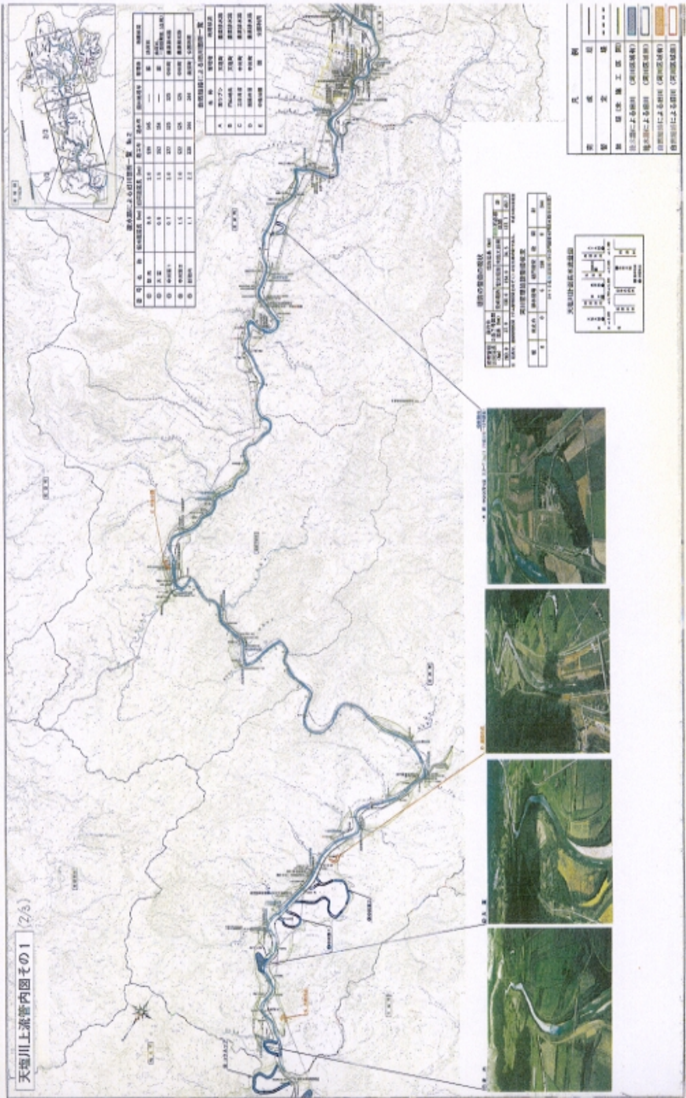
天竜川上流管内図その1 (2/3)