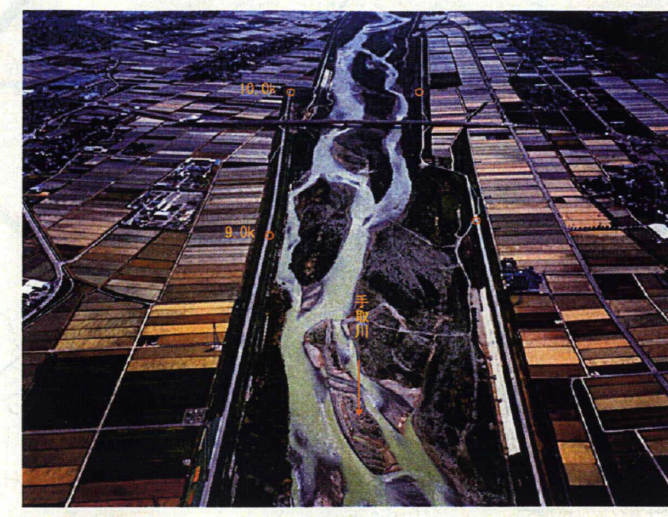
② 手取川河口より9km付近