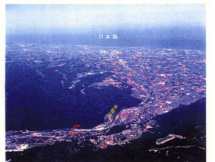
④ 手取川扇状地 (扇頂部より日本海を望む)