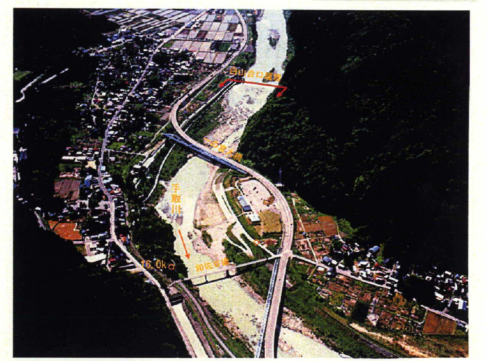
③ 手取川河口から16.0km付近 (白山合口堰堤下流)