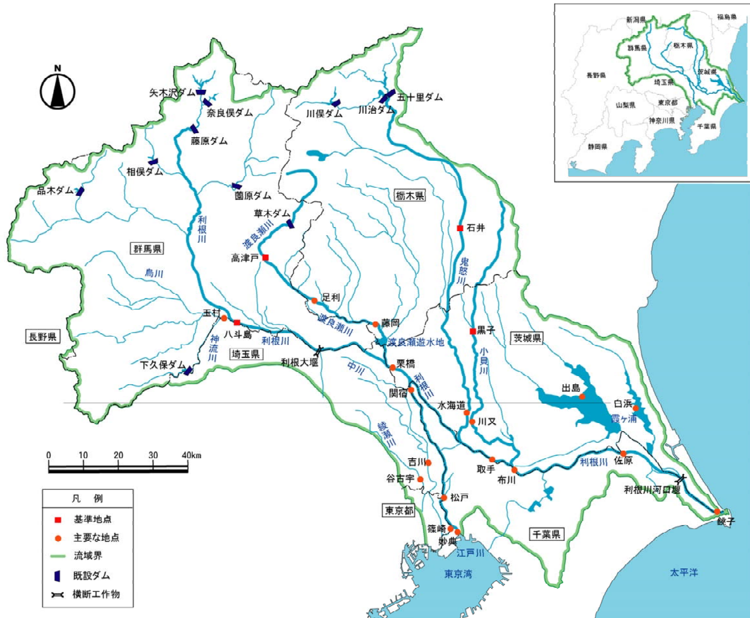
(参考) 利根川水系図