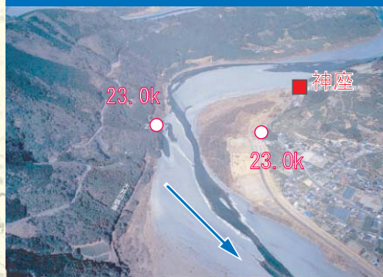
④ 神座地点(基準地点)