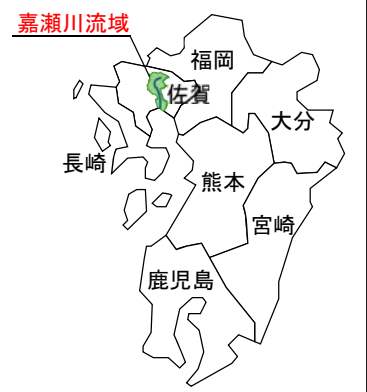
嘉瀬川水系位置図