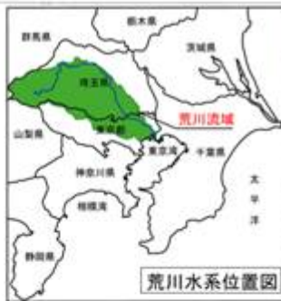
⑩ 荒川 寄居地点