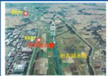
③ 荒川 秋ヶ瀬地点