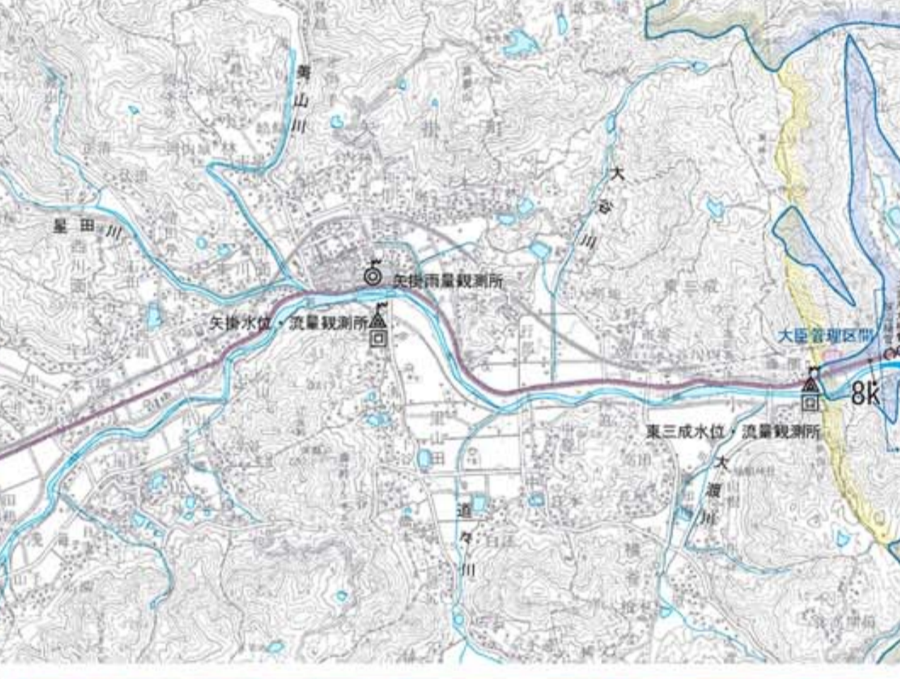
小田川下流 (小田川)