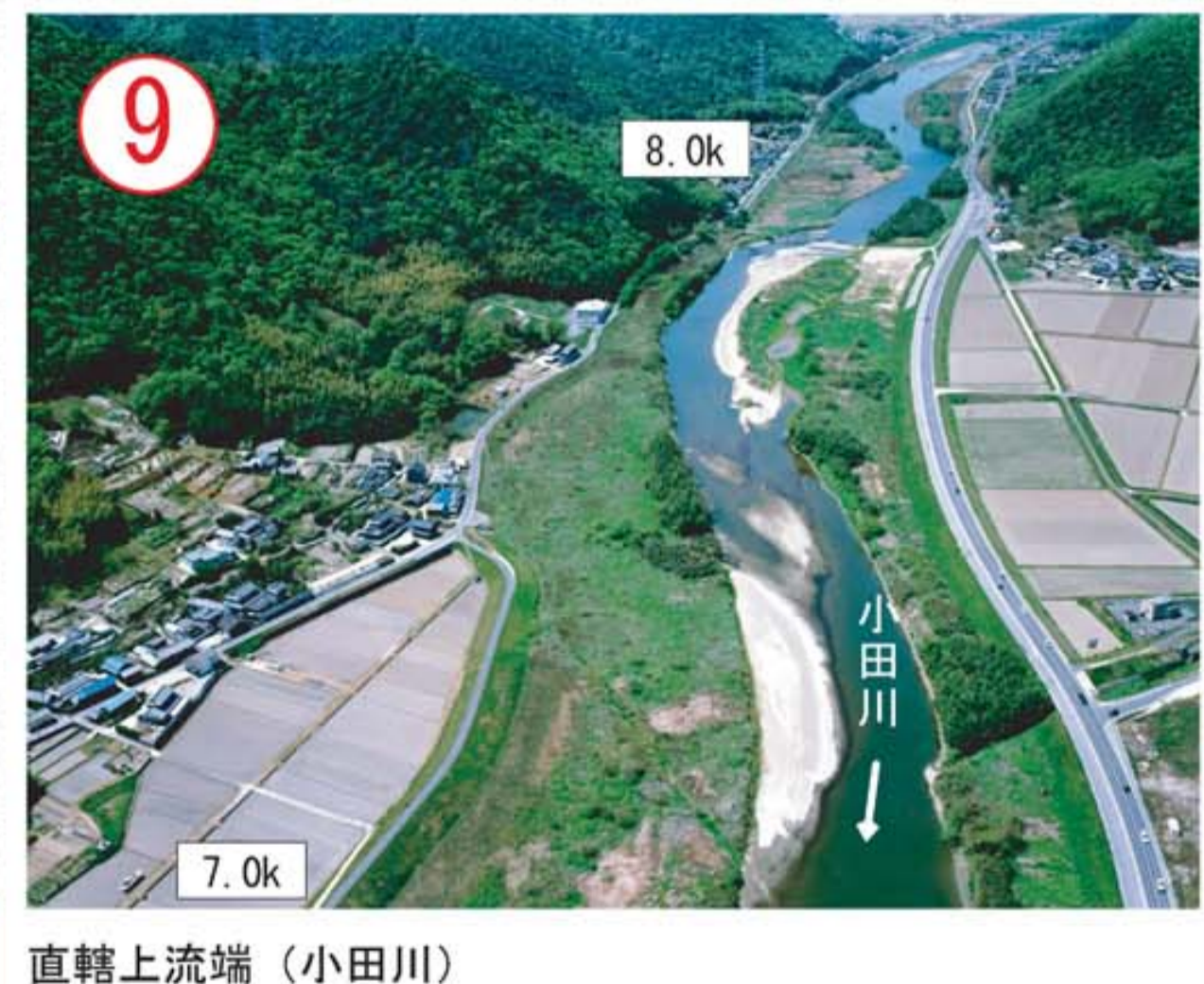
直轄上流端 (小田川)