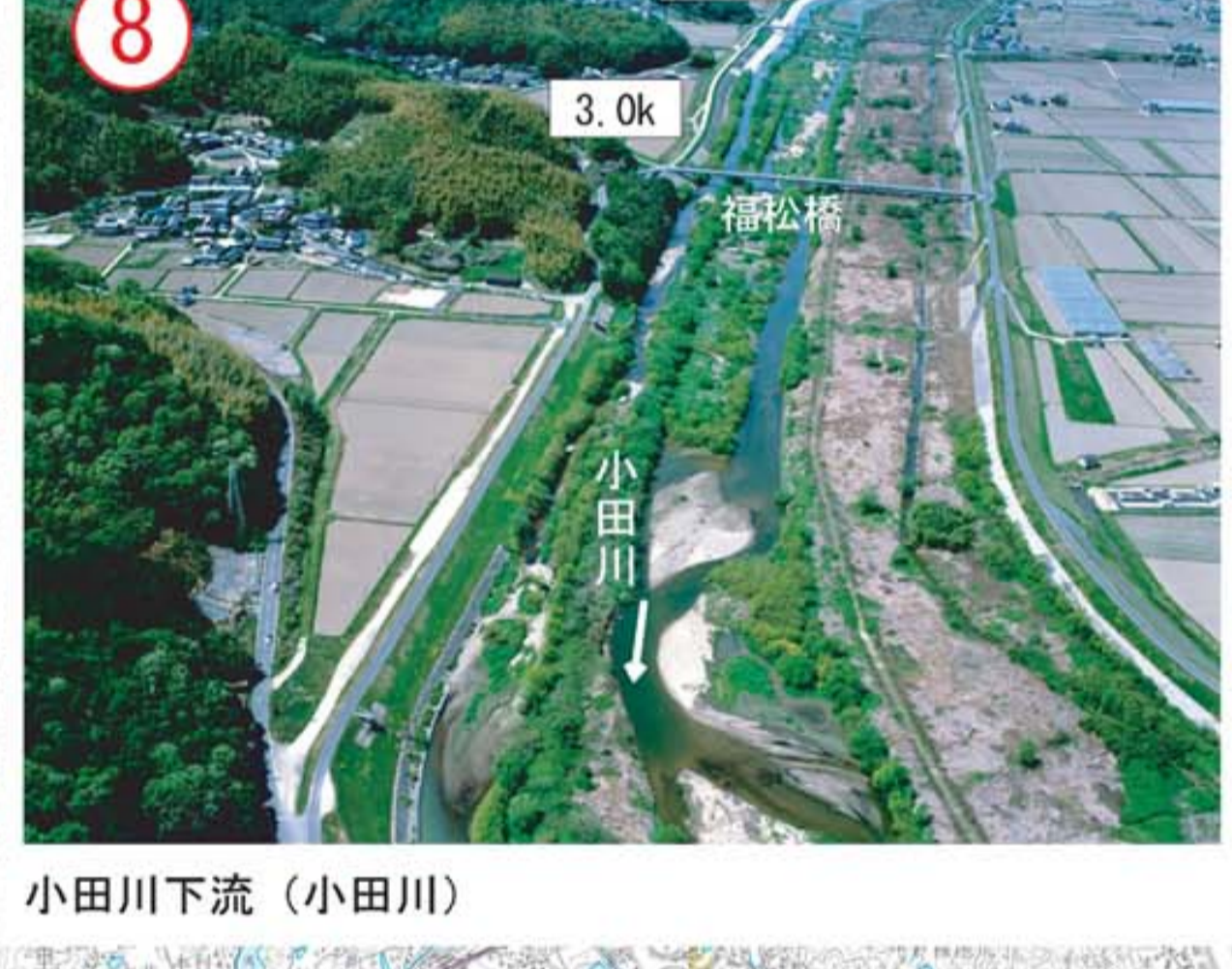
小田川下流 (小田川)