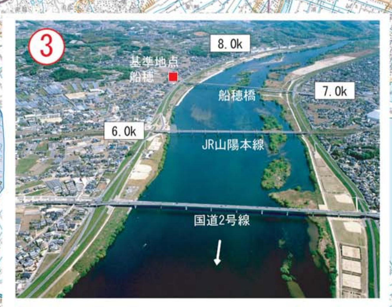
基準地点船穂付近