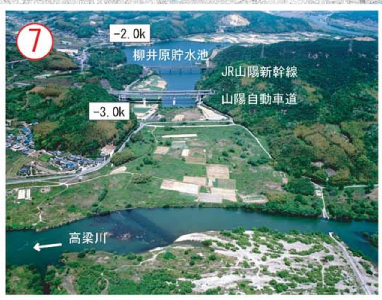
本川への合流点 (高梁川派川)