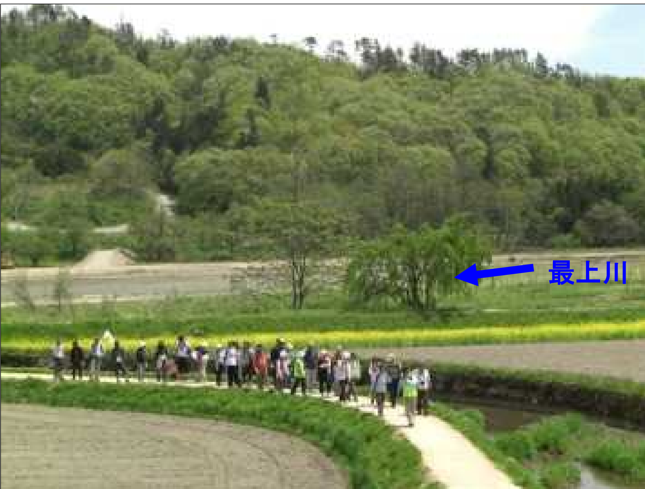
古くから愛される最上川の景観を活かし、散策路を整備(フットパス)