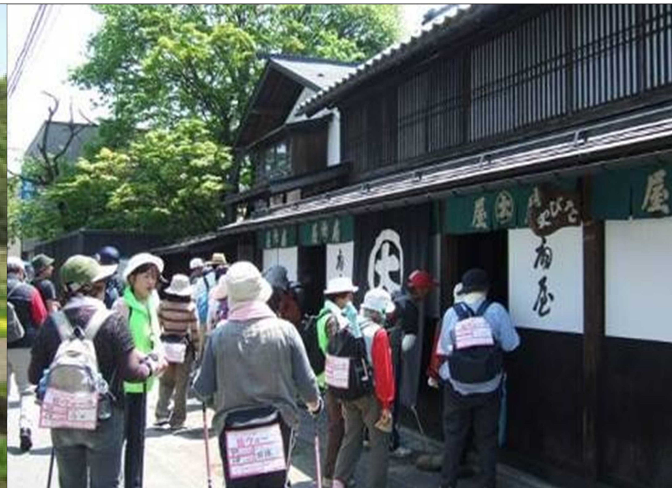
舟運で栄えた旧商家などを開放