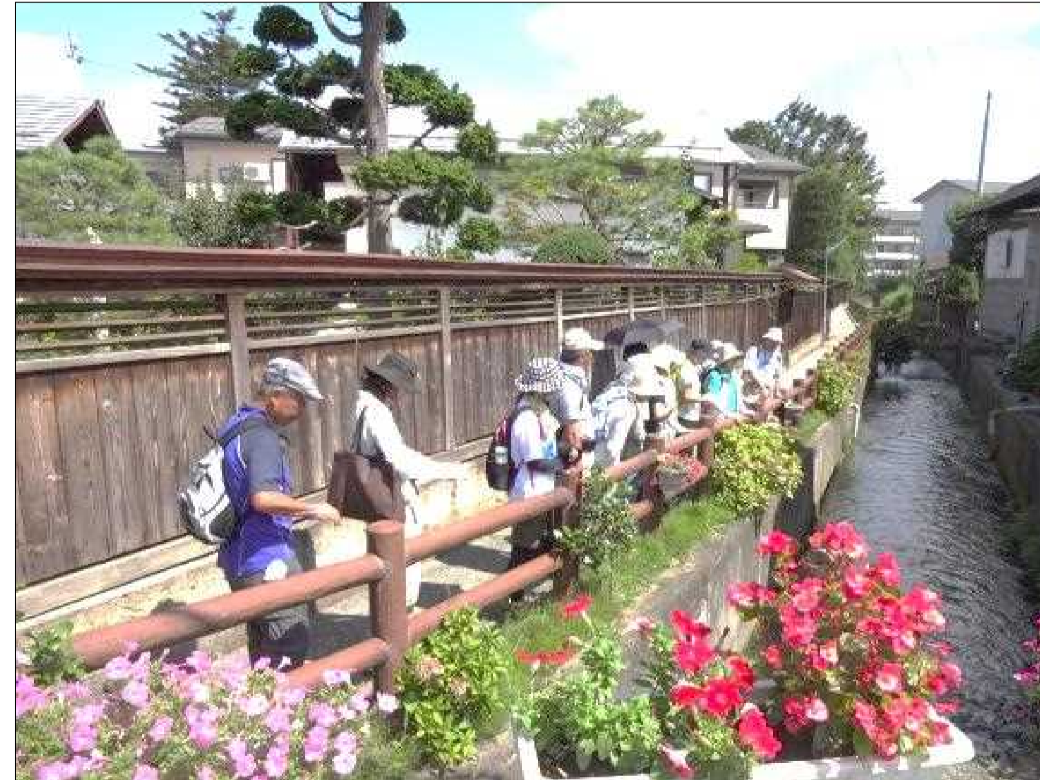
町なか水路への導水や散策路(フットパス)の整備により水辺のまちを再生