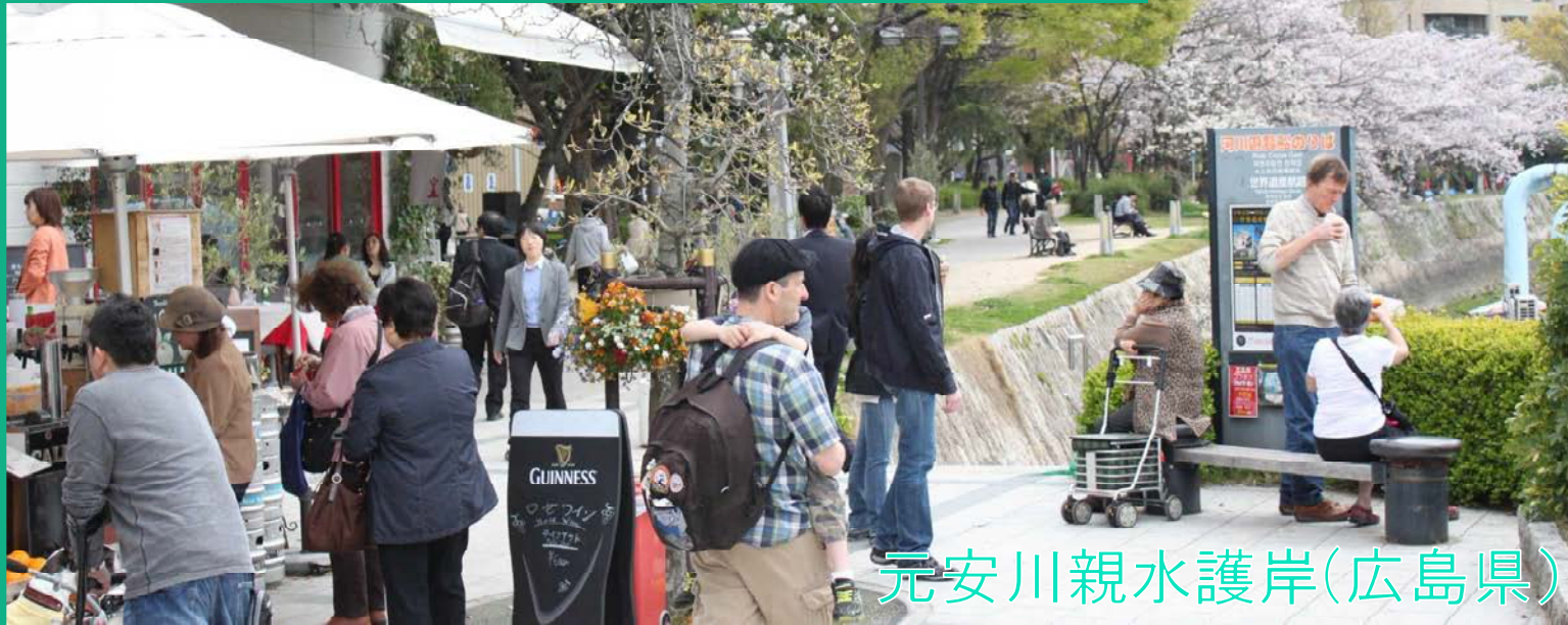
元安川親水護岸(広島県)