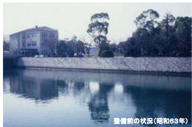
整備前の状況(昭和63年)