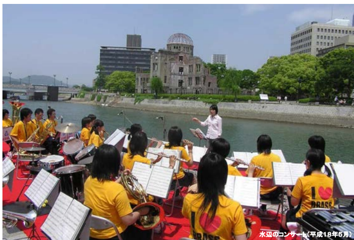
水辺のコンサート(平成18年5月)