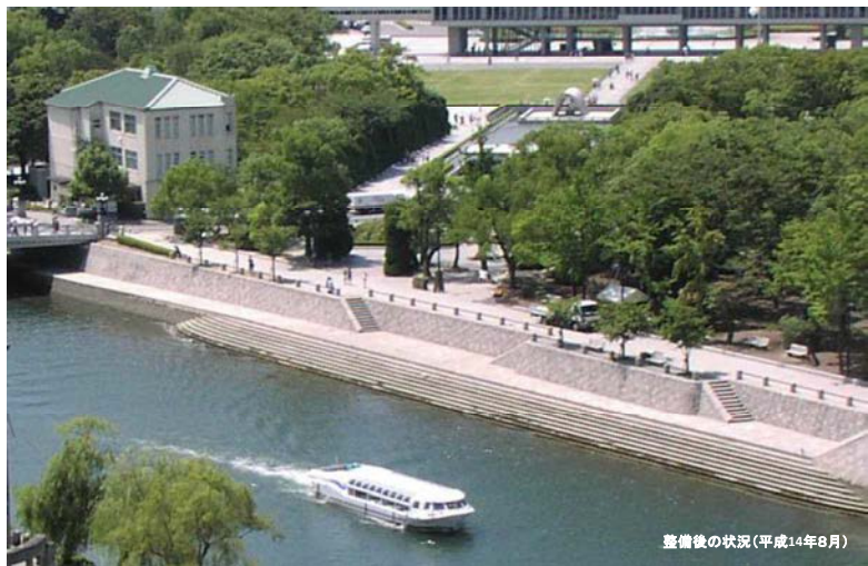
整備後の状況(平成14年8月)

世界遺産原爆ドーム前や平和記念公園を流れる元安川において、親水テラス等の整備により、「水の都ひろしま」にふさわしい風景を創出