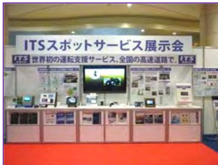
【パネルによるサービス概要の紹介及び各社車載器の展示】