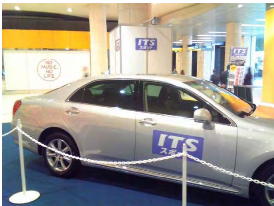
【トヨタ：マジエスタ】