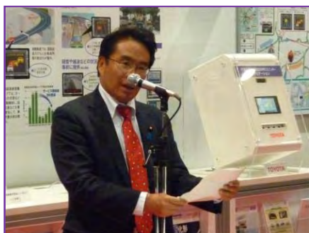
【松原副大臣の挨拶】