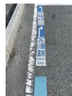
下関駅北駐輪場(サイクルステーション)