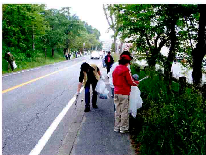
そうべつくだもの村等主催453（よごさん）キャンペーン H17.6.19 道道洞爺湖登別線 壮瞥町洞爺湖温泉