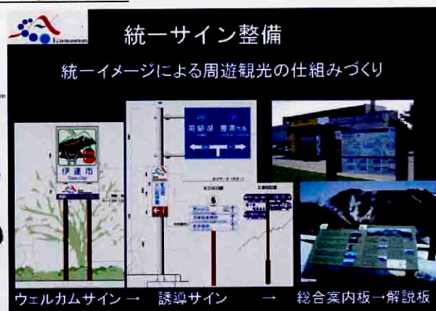
道路管理者、市町村が連携して推進されている エコミュージアムサイン整備