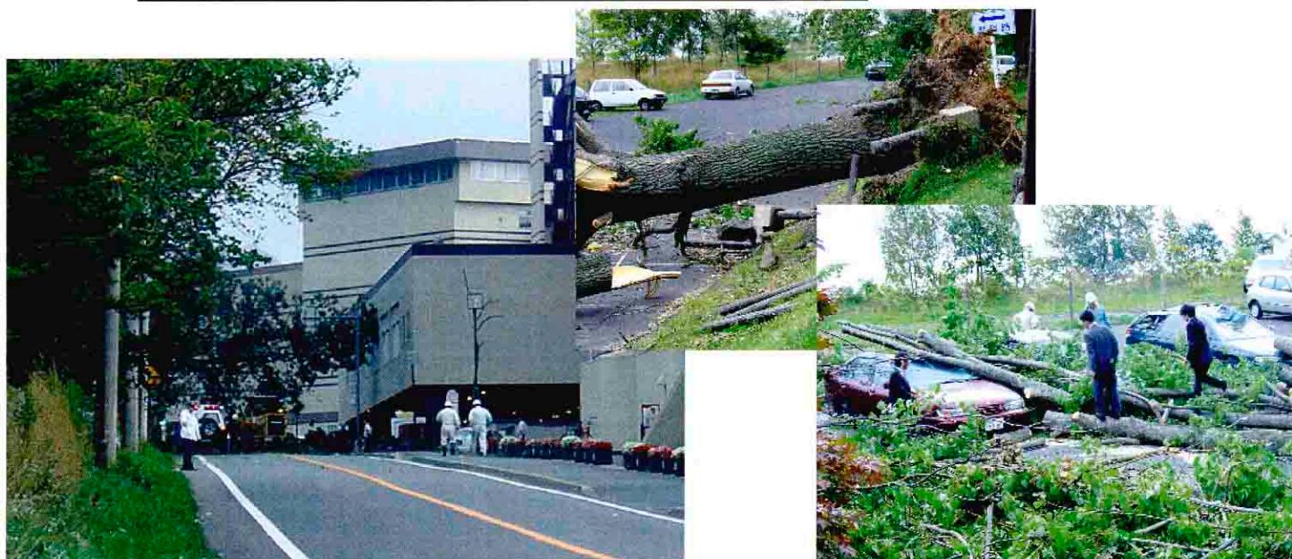
H16.9.8 台風 18 号災害 道道洞爺湖登別線 大型ホテル周辺の倒木

このようなことから、 道路の防災対策事業と維持管理の充実は、地域経済の活性化、地域振興上、不可欠であり、地域住民と多くの来遊者の安全・安心を確保する観点からも、重点的な施策の展開が必要である。