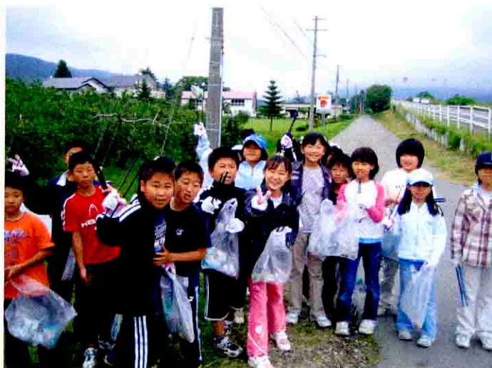
壮瞥小学校による国道453号清掃活動 国道453号道の駅そうべつサムズ周辺

これからの道路政策は、美しい国「日本」を創造するための「根幹」の政策と認識しているところであり、このことを念頭において推進されるべきである。 また、各種施策の展開にあたっては、道路管理者と基礎的自治体が進める まちづくりとの連携や、地域住民との協働による施策の展開が必要である。