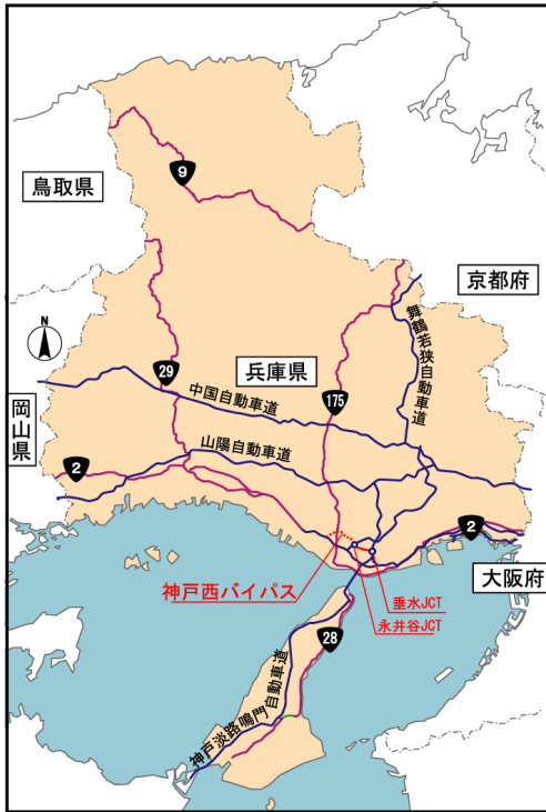
事業概要図 【位置図】